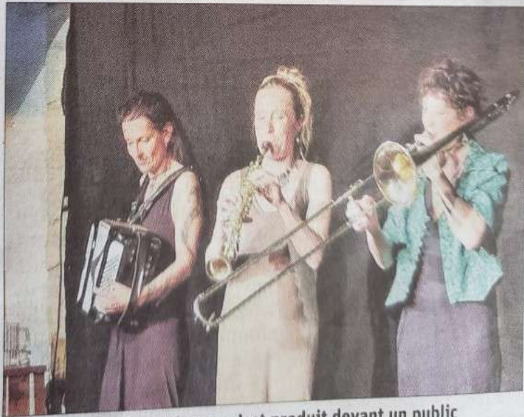
Le groupe des Souricieuses s'est produit devant un public de tous âges conquis par le spectacle.