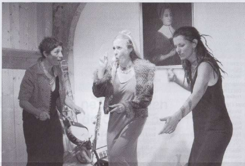
Les Souricieuses, trois femmes de France voisine qui aiment la vie, les gens et qui le démontrent avec talent et énergie.

Panaïs, Raves et Salsifis, une association à suivre et à encourager impérativement: www.panais-raves-salsifis.ch